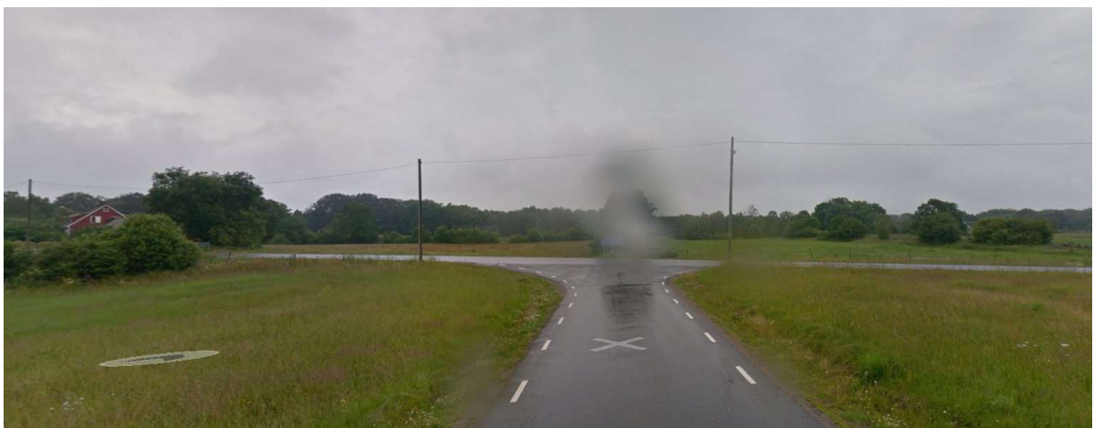
Vänster mot Svensköp.