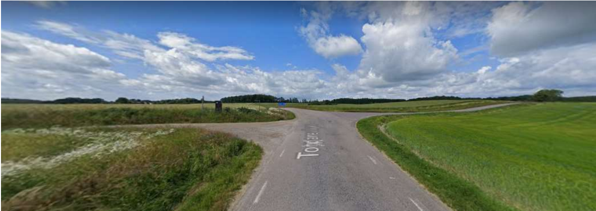
Följ vägen svagt vänster (Trolleholm).