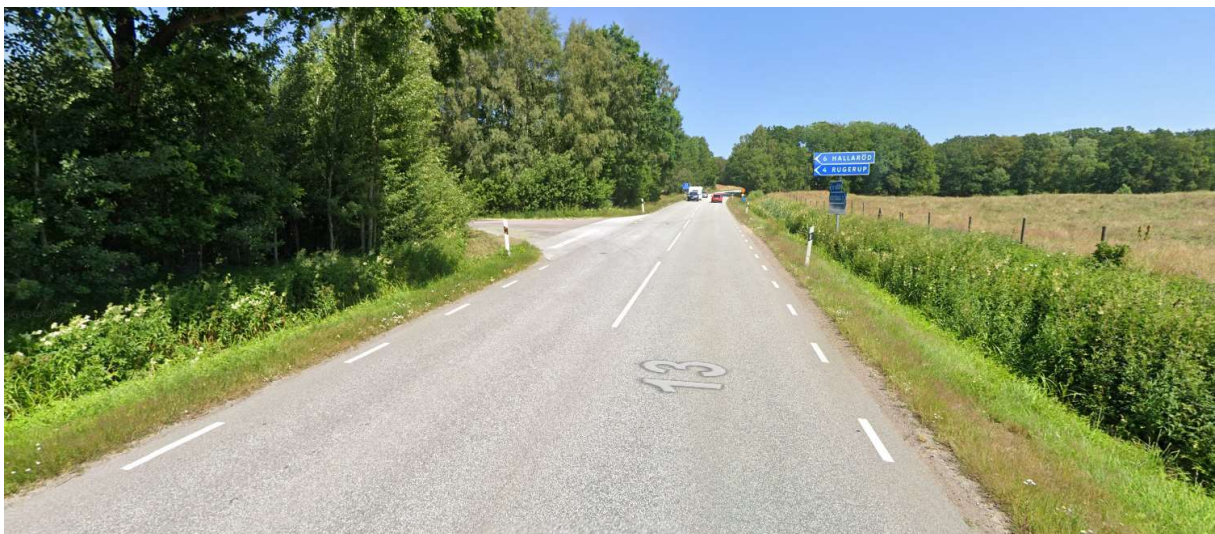
Vänster mot Hallaröd.