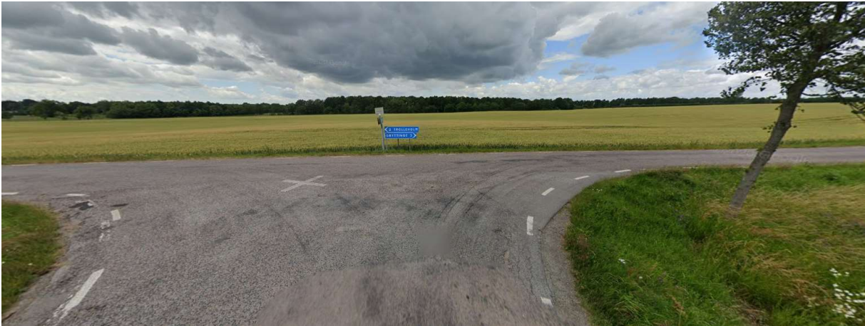
Höger mot Gryttinge.