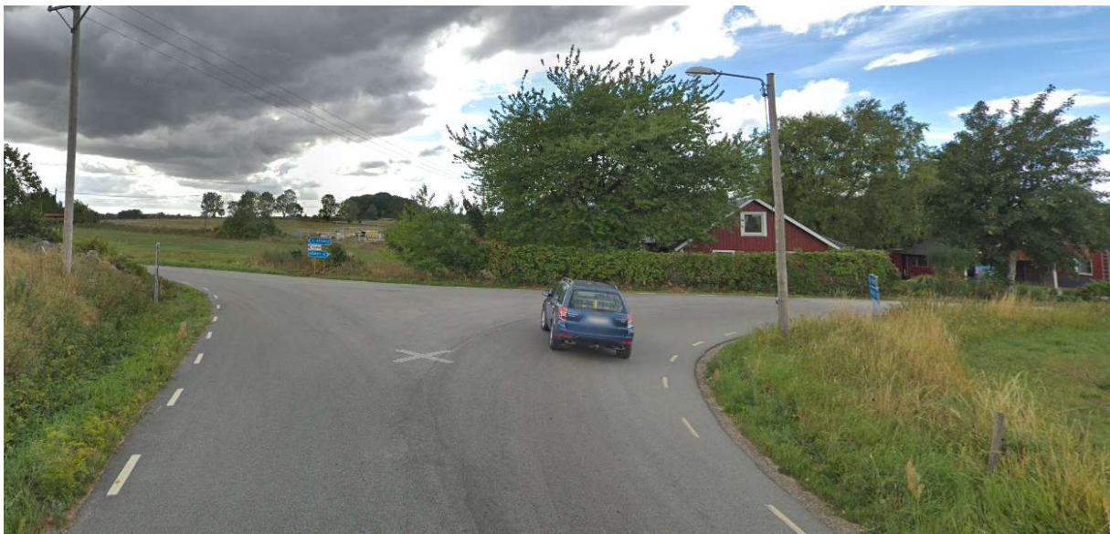
Efter Äspinge – tag höger mot Hörbý och köra ca 10km.