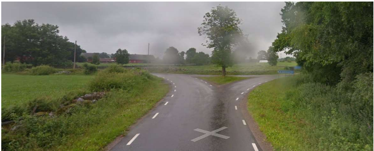
Vänster mot Svensköp.