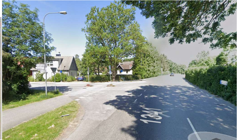
Mitt i Sätofta – tag vänster in på Nybyvägen