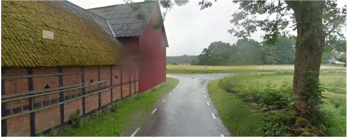
Höger mot Harphult.