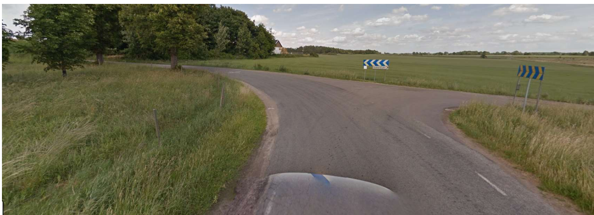
Följ vägen åt vänster.

Edvard Perssons debutfilm som både regissör och skådespelare, Studenterna på Tröstehult från 1924, spelades delvis in på Hjularöd. Utomhusscener för julkalendern Mysteriet på Greveholm 1996 spelades in på slottets borggård liksom scener för uppföljaren Mysteriet på Greveholm – Grevens återkomst 2012.