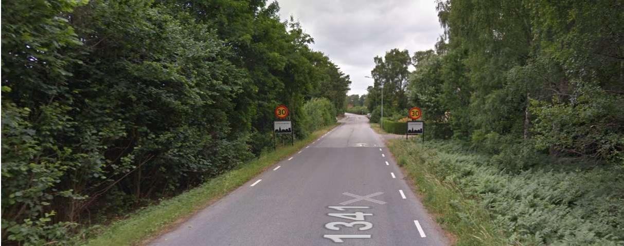
Fortsätt genom Ludvigsborg.