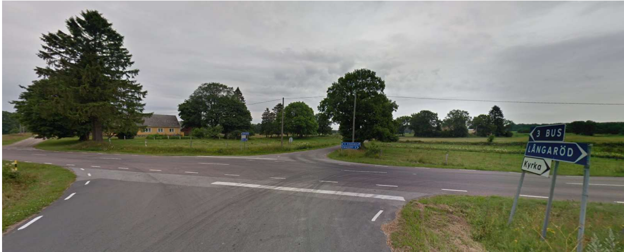
Vid stopplikten fortsätt rakt fram mot Bus.