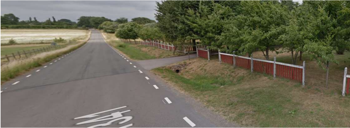
Efter grusvägen, tag till vänster mot Ludvigsborg (troligen ingen synlig skylt).