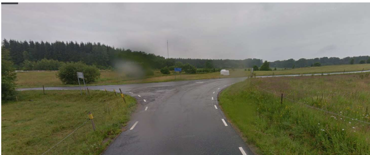
Höger mot Bönhult.