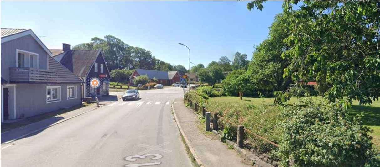
I Billinge tag höger vid konditoriet.