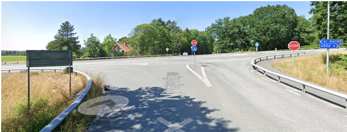
Rakt fram (västerut) i korsningen