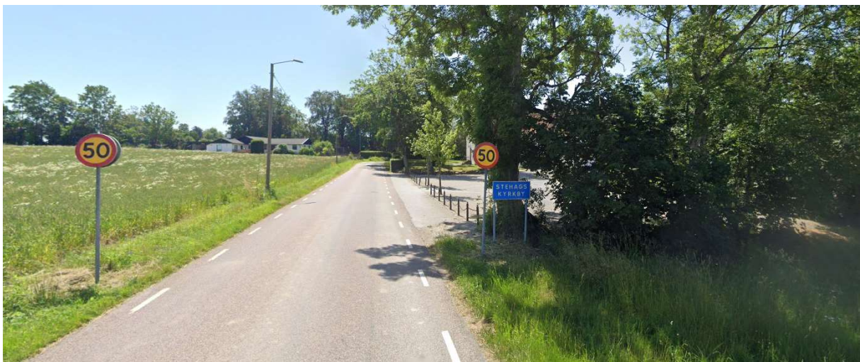
Passera Stehags Kyrkby.