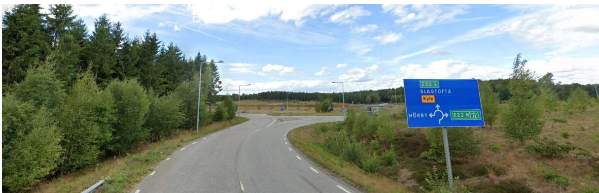
Rakt fram i rondellen mot Slagtofta.