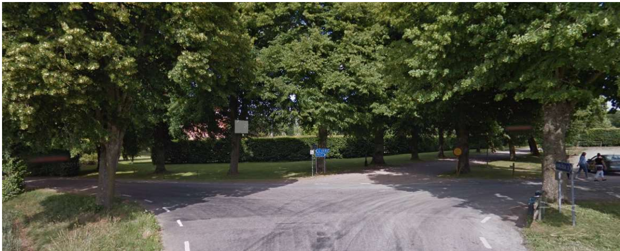
Vänster mot Orås. Passerar här Hjularöds slott.

Edvard Perssons debutfilm som både regissör och skådespelare, Studenterna på Tröstehult från 1924, spelades delvis in på Hjularöd. Utomhusscener för julkalendern Mysteriet på Greveholm 1996 spelades in på slottets borggård liksom scener för uppföljaren Mysteriet på Greveholm – Grevens återkomst 2012.