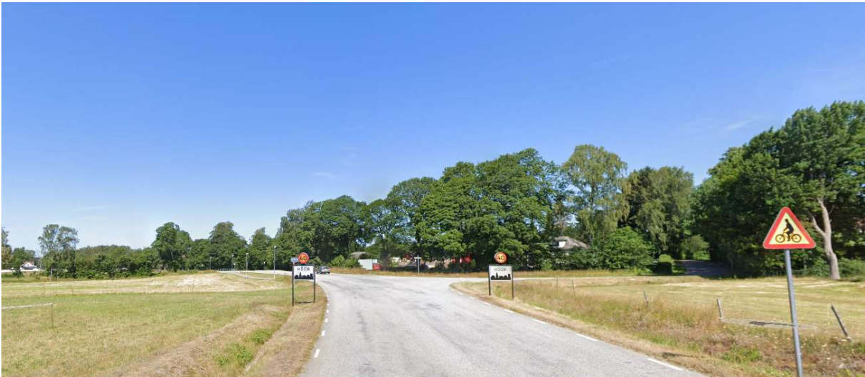
Köör in i Höör.