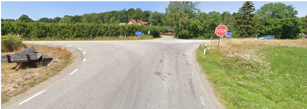
Höger mot Röstånga.