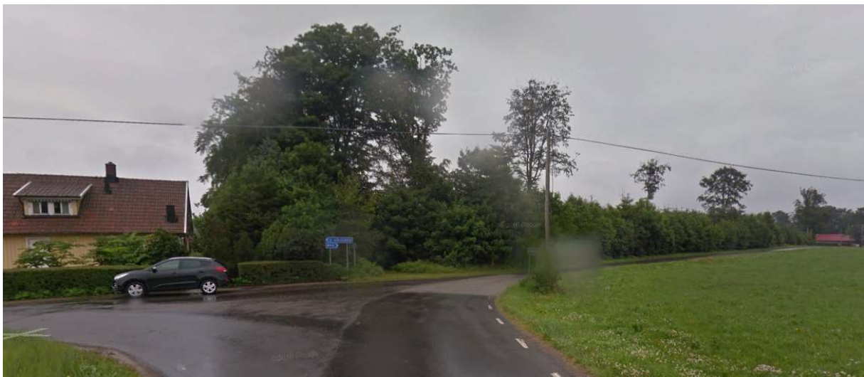
Fortsätt mot Bus (till höger).