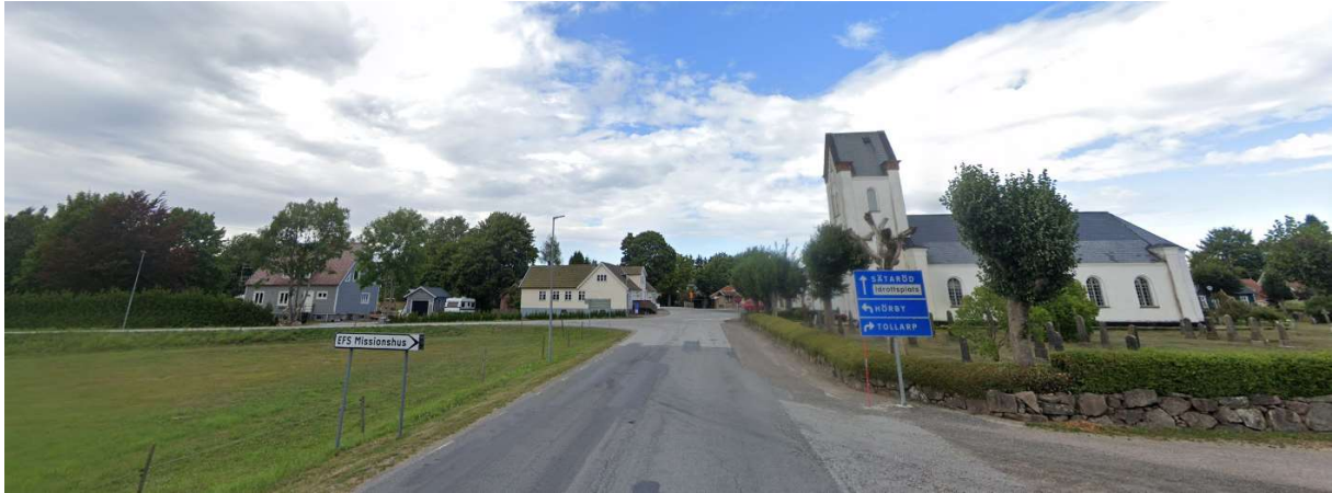
I Killhult – tag vänster mot Hörbý.