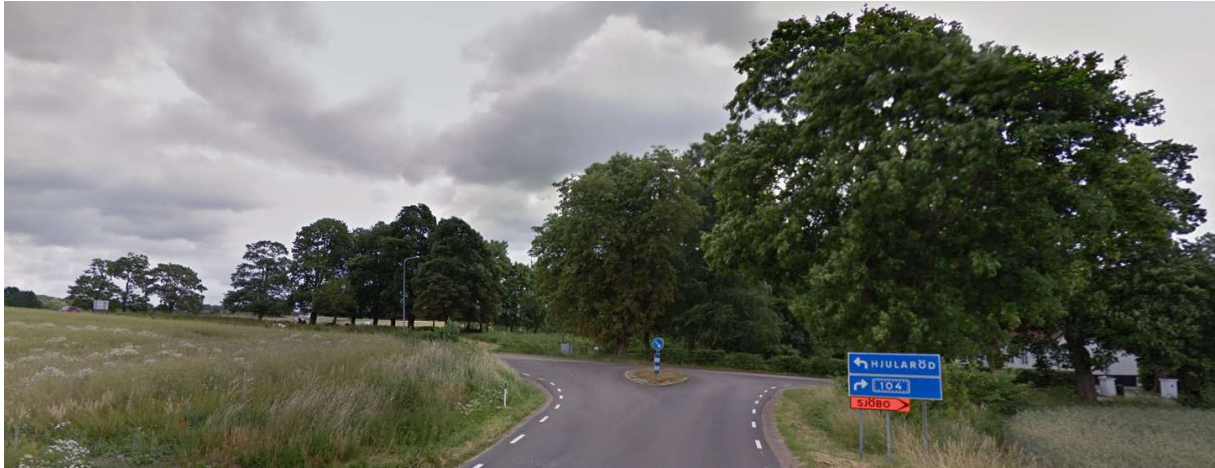
Vänster mot Hjularöd.