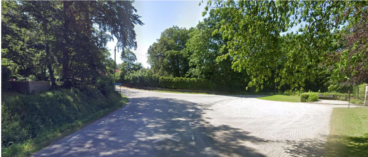
Vid Stehags kyrka tag höger mot Stehag.